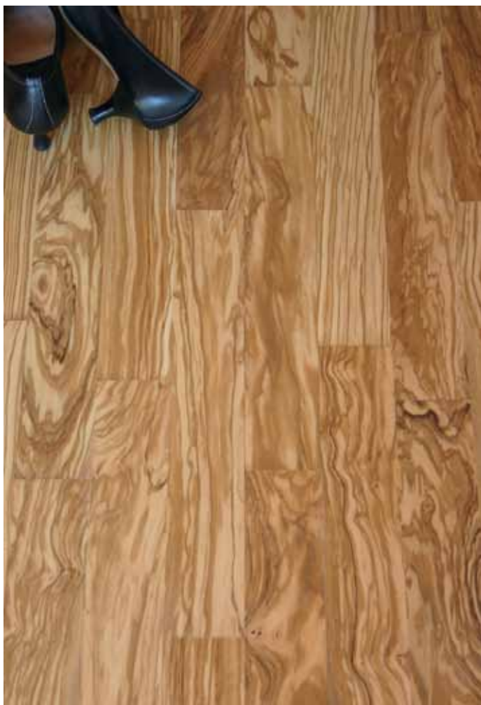
Die Sortierung „Natur“: eine Struktur wie der Olivenholzbaum selbst. 018 02

Erst unter diesen Bedingungen erzielt das Holz seine hohe Widerstandsfähigkeit und erhält seine einzigartige Maserung. Im Sortiment: das exquisite Zweischicht-Fertigparkett, erhältlich in den Sortierungen Venato Extra, Zebrano, Grigio und Natur. Mehr unter www.olivenholzparkett.de .